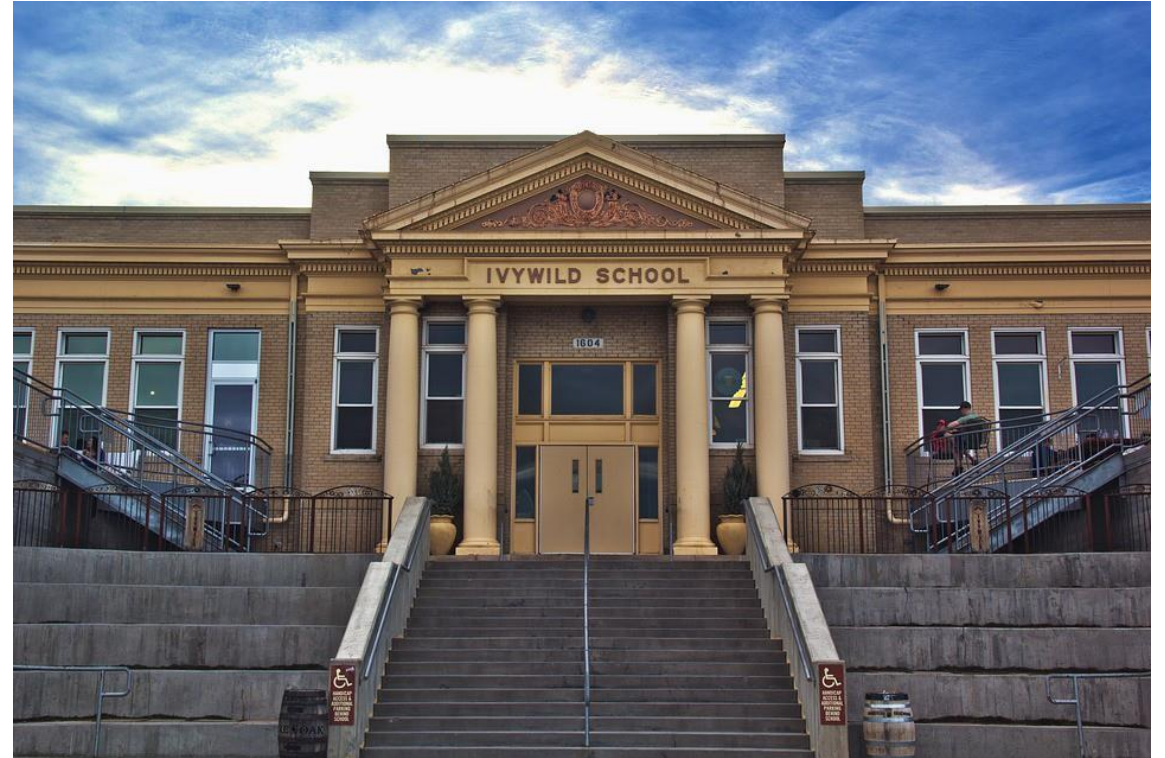
Old Lenox High School, Lenox, MA